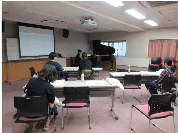
図6 産後母子のコンサートの様子