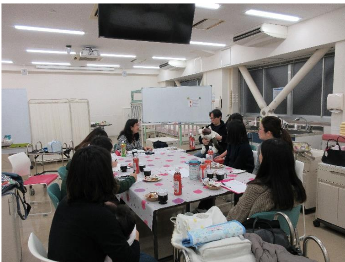
図7 小児科医の講話の様子