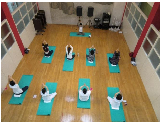
図1 マタニティヨガの様子