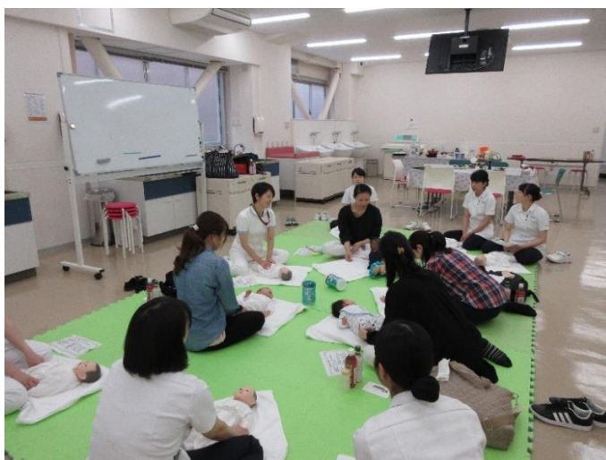
図4 ベビーマッサージの様子