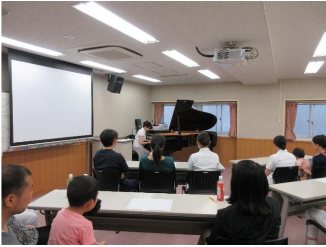
図5 マタニティコンサートの様子