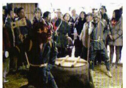
山の神たちの登場

約十五年間、私は日本海側の新潟県と秋田県に住みました。これらの県には、多くの素晴らしいものがありますが、最も素晴らしいものは彼らの祭りではないかと、私は思います。祭りには、主に三つの大きな活動(踊り、神輿、音楽)があります。それぞれが地元の祭りに参加する。