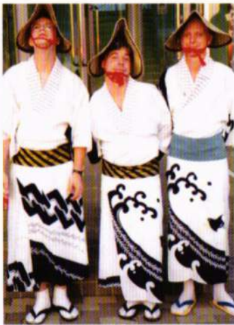
中条祭りに参加するアメリカ人

約十五年間、私は日本海側の新潟県と秋田県に住みました。これらの県には、多くの素晴らしいものがありますが、最も素晴らしいものは彼らの祭りではないかと、私は思います。祭りには、主に三つの大きな活動(踊り、神輿、音楽)があります。それぞれが地元の祭りに参加する。