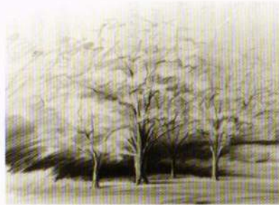
北の丸公園スケッチ